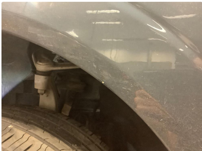
1.1 Liten steinsprut i skjerm