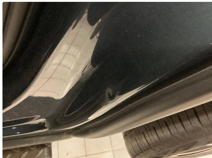
1.2 Liten bulk