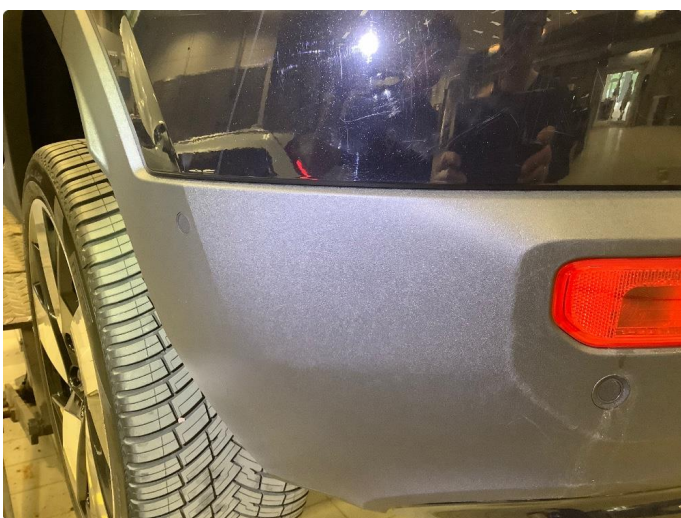
1.3 Merker på plast fanger bak