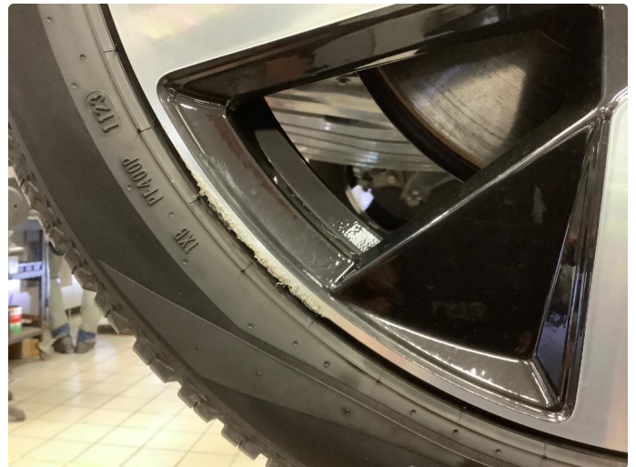
1.2 Lite merker i felg Diamond Cut