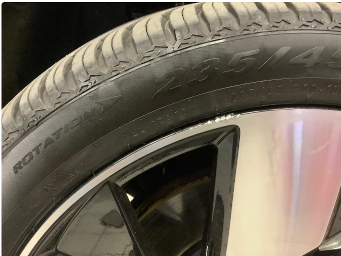
1.2 Lite merker i felg Diamond Cut