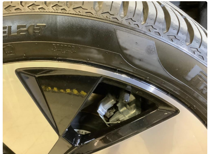
1.2 Lite merker i felg Diamond Cut