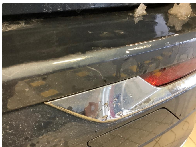
1.3 Ripe(r) ned til grunning