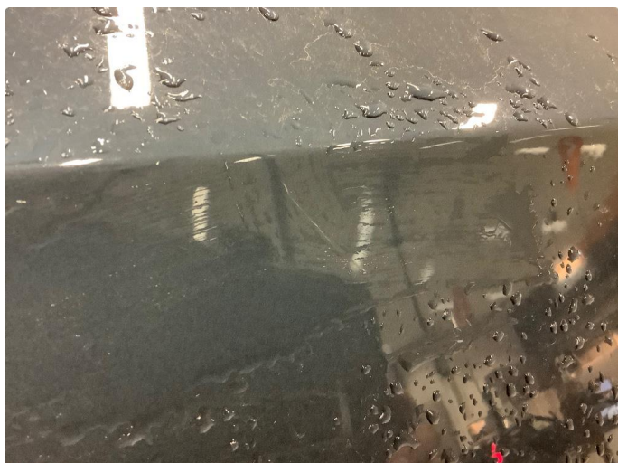
1.1 Ripe(r) ned til grunning