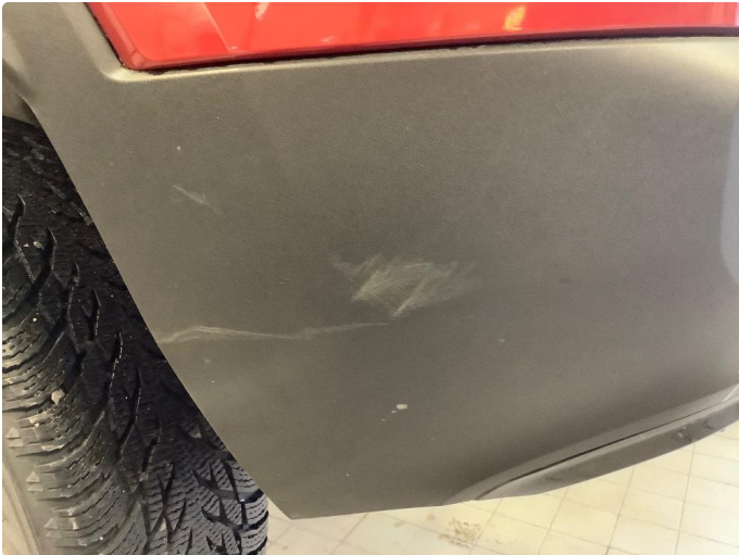
1.1 Merker i fanger bak i plasten