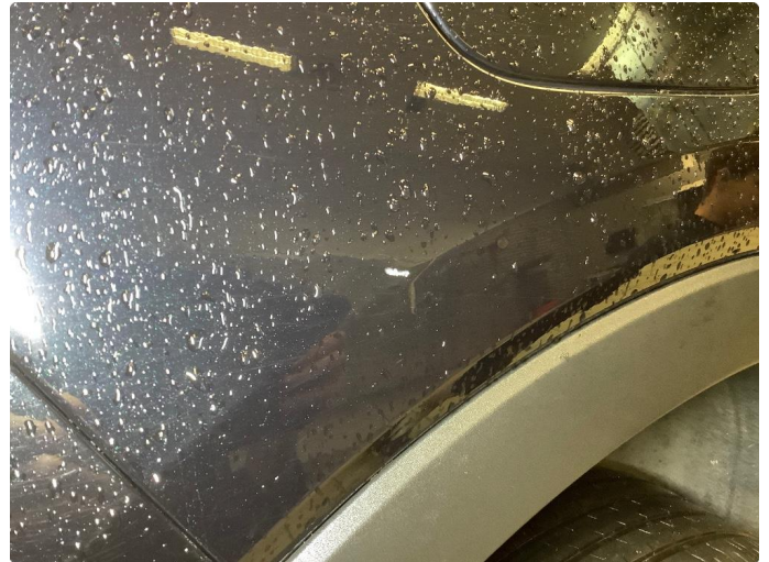
1.2 Liten skade