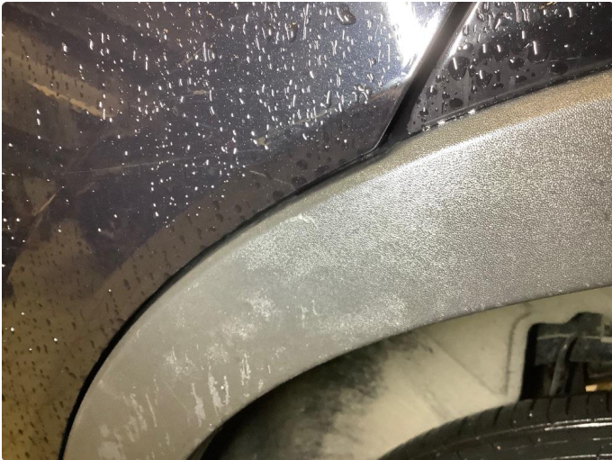
1.1 Skjermutbygger liten skade