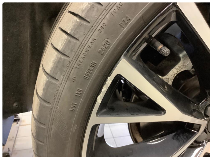
1.1 Lite merke på felger