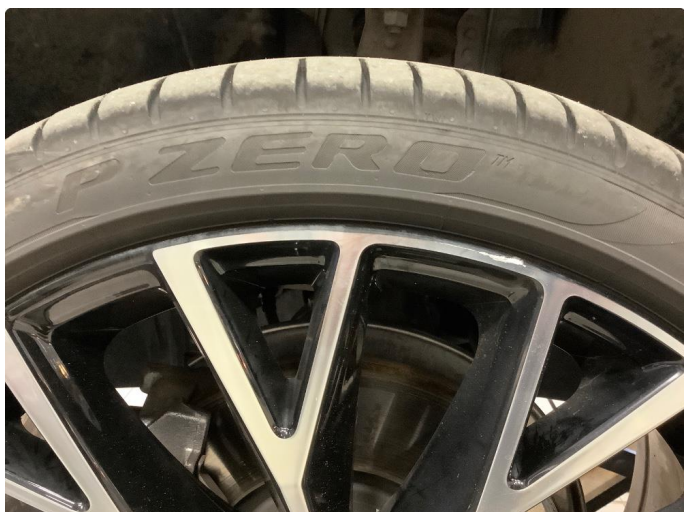
1.1 Lite merke på felger