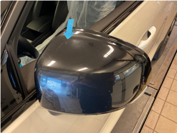
1.1 Speilhus riper