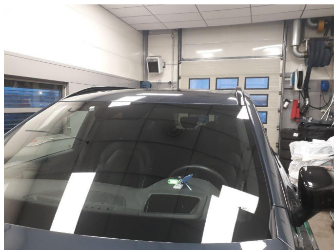
1.2 Steinsprut i synsfelt