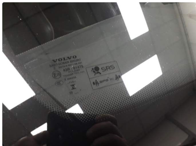
1.2 Steinsprut i synsfelt