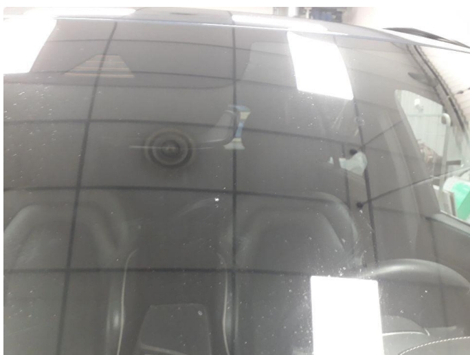
1.2 Steinsprut i synsfelt