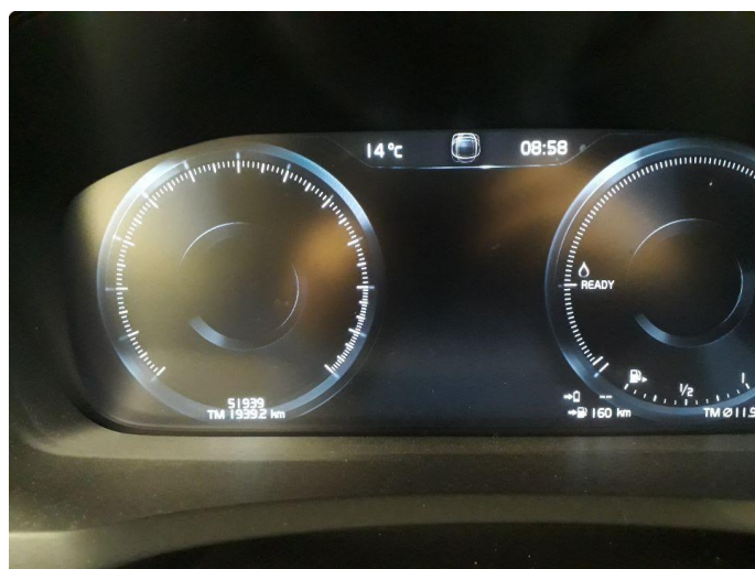
1.2 Steinsprut i synsfelt