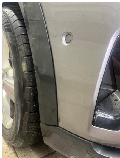
1.1 Ripe/lakk (halv del)