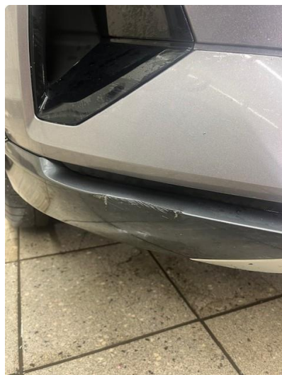
1.1 Ripe/lakk (halv del)