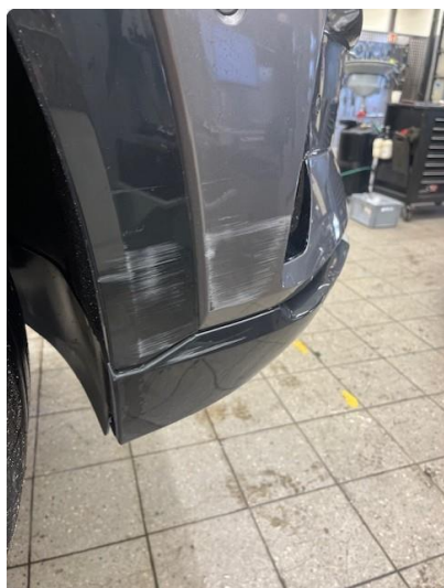
1.1 Ripe/lakk (halv del)