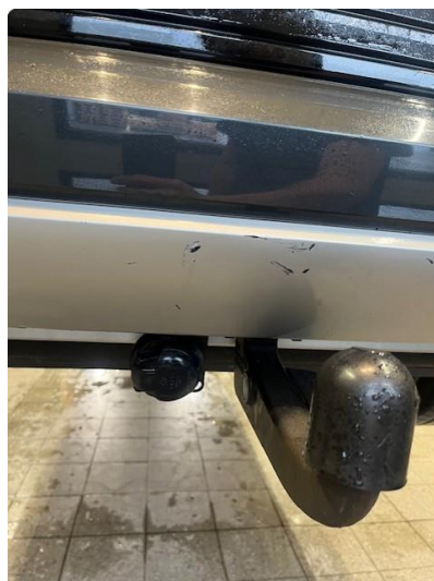
1.2 Ripe(r) ned til grunning