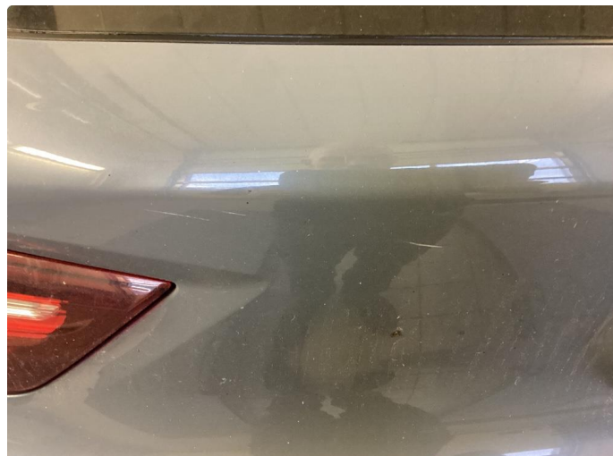
1.1 Noen riper