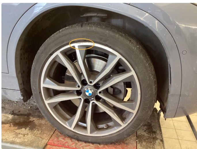
1.2 Kantkjørt felg Diamond Cut