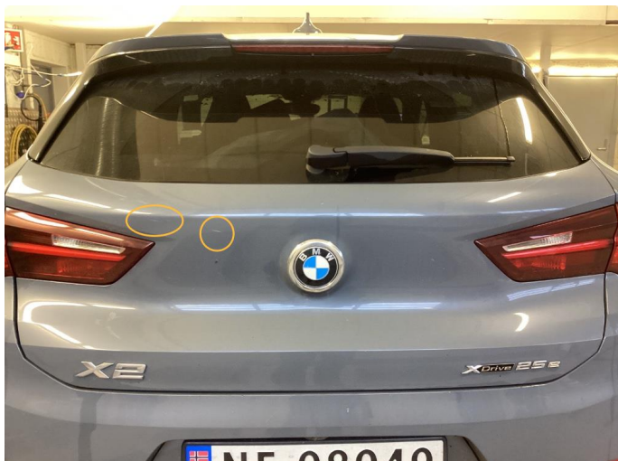
1.1 Noen riper