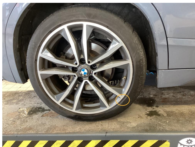
1.2 Kantkjørt felg Diamond Cut