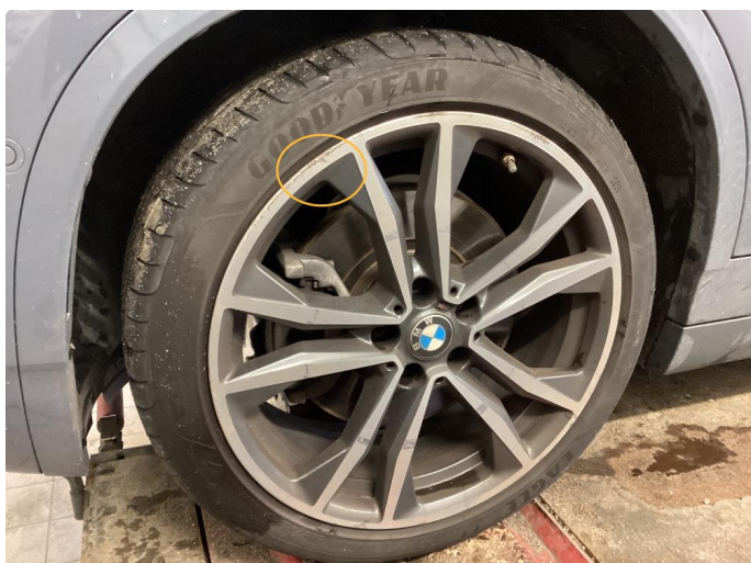
1.2 Kantkjørt felg Diamond Cut