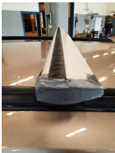
2.8 Øvrige feil