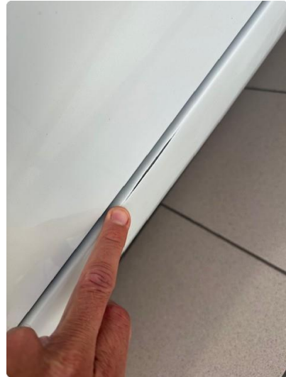
1.2 Slitasje lakk innsteg førerside.