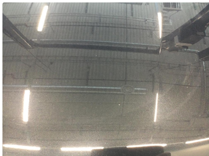
1.2 Noe steinsprut