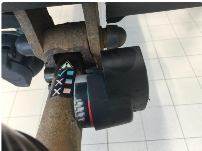
1.1 Fastirret hengerfeste