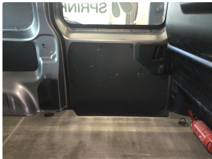
2.1 Deksler skadet/mangler