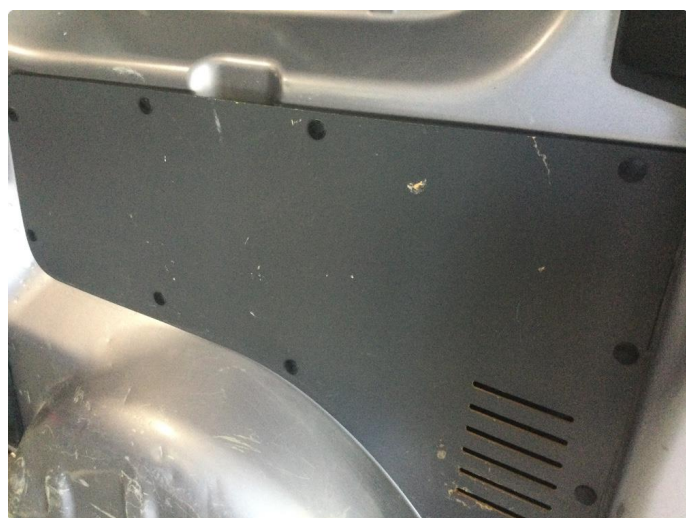
2.1 Deksler skadet/mangler