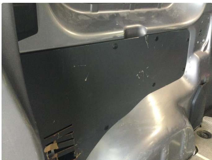
2.1 Deksler skadet/mangler