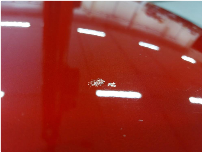
1.1 Fire steinsprut med rustdannelse.