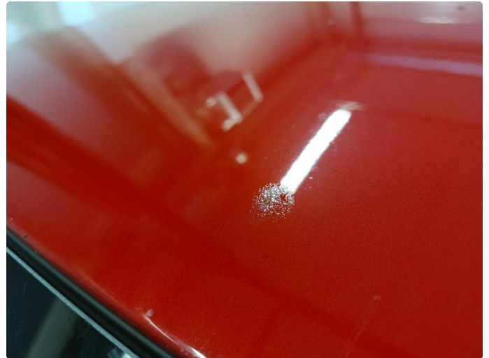
1.1 Fire steinsprut med rustdannelse.